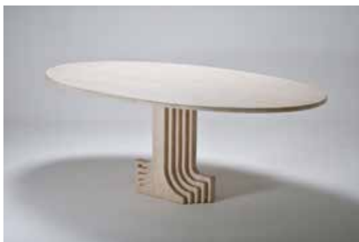
Table SAMO Designer: Carlo Scarpa Année de création: ca.1970 Éditeur: Simon

Nous vous dévoilons en avant-première quelques coups de cœur à chiner durant cette édition anniversaire du Salon du Design.