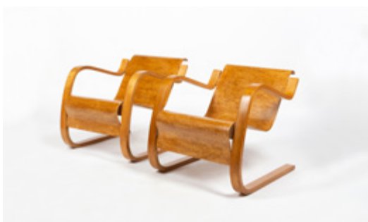
Fauteuils "31" Designer: Alvar Aalto Année de création: 1932

Chez Alexandra Alge Möbelagentur, Wolfurt (AT)