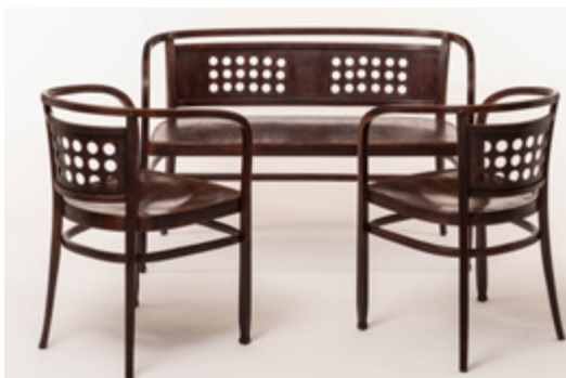
Fauteuils et banc Designer: Otto Wagner Année de création: 1902 Éditeur: J&J Kohn

Chez Enthusiastic Approval, Zurich