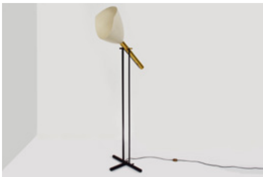
Lampe sur pied "Televisione" Designer: Angelo Lelii Année de création: 1954 Éditeur: Arredoluce

Chez Messy Dessy, Genève