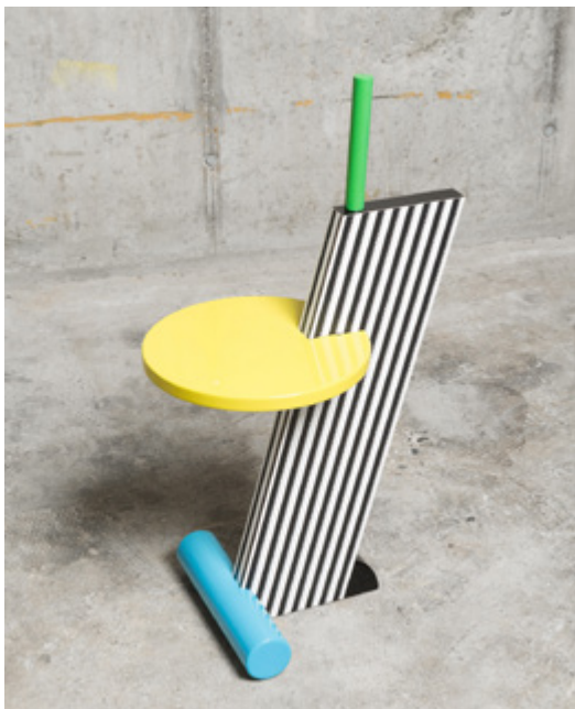
Table d'appoint "Flamingo" Designer: Michele De Lucchi Année de création: 1984 Éditeur: Memphis Milano

Chez Demosmobilia, Chiasso