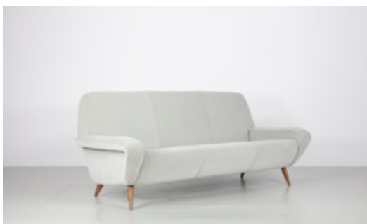
Canapé mod. 830 Designer: Gianfranco Frattini Année de création: ca.1950 Éditeur: Cassina

Chez Kissthedesign, Lausanne