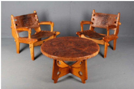
Ensemble en bois et cuir Designer: Angel Pazmino (Équateur) Année de création: 1960

Chez Messy Dessy, Genève