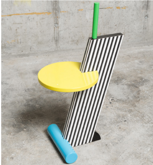
Table d'appoint "Flamingo" Designer: Michele De Lucchi Année de création: 1984 Éditeur: Memphis Milano

Quelques belles pièces à découvrir en avant-première, en attendant de pouvoir les admirer en vrai pendant la quatrième édition du Salon du Design.