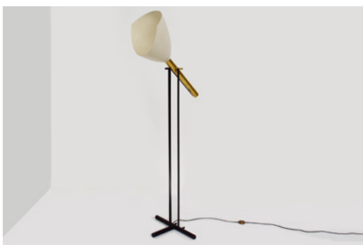
Lampe sur pied "Televisione" Designer: Angelo Lelli Année de création: 1954 Éditeur: Arredoluce

Chez CH Design Furniture, Cheyres