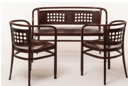
Fauteuils et banc Designer: Otto Wagner Année de création: 1902 Éditeur: J&J Kohn

Chez Demosmobilia, Chiasso