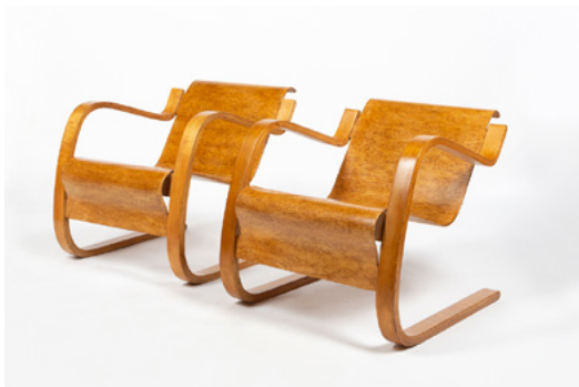
Fauteuil "31" Designer: Alvar Aalto Année de création: 1932

Chez CH Design Furniture, Cheyres