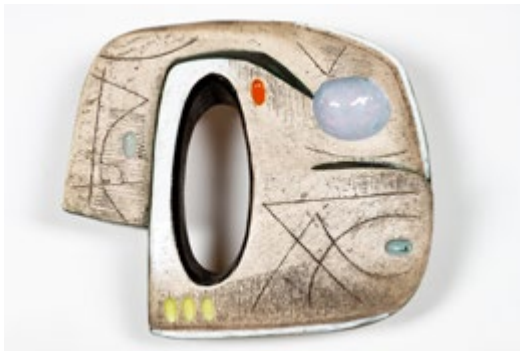
Sculpture murale en céramique Artiste: André Gignou Année de création: 1951

Chez CH Design Furniture, Cheyres