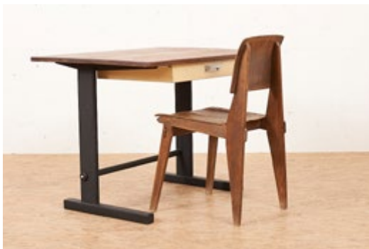
Chaise "tout bois" (1941) et bureau "Cité Tropique Nr. 501" (1951) Designer: Jean Prouvé Éditeur: Atelier Jean Prouvé

Chez CH Design Furniture, Cheyres