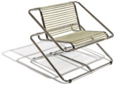
"Rocking Chair" Designer: Ron Arad Année de création: 1981 Éditeur: One Off Ltd., UK